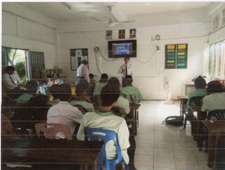
นำเสนอผลงานภายนอก ณ โรงเรียนอนุบาลหนองไผ่